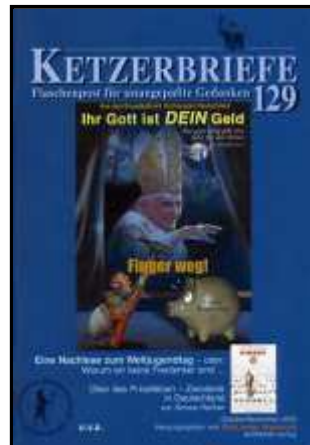
Ketzerbriefe 129 EUR 4,50 / sFr 8,10 ISBN 3-89484-238-5