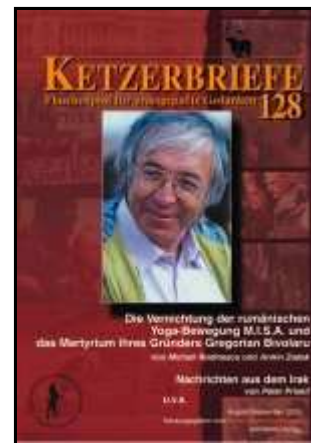
Ketzerbriefe 128 EUR 4,50 / sFr 8,10 ISBN 3-89484-237-7