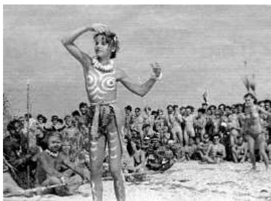
Sog. »Kameruner Fest« am Ostseebad von 1953(!)

Blutrünstig war die SED freilich nicht, aber auch nicht so demokratisch, wie sie und viele andere mit unterschiedlichem Tarnanstrich bis heute da und dort behaupten – sie war schikanös, unselbständig und vor allem schwach – ; denn erstens hatte sie als blasser Schatten einer durch Stalins und seines deutschen Vertrauten Herbert Wehners blutige Mühlen gedrehten, von Hitler vordezimierten Rest-KPD keine eigene Kraft mehr, zweitens konnte sie nicht auf eine Jahrtausende lang kontinuierliche weihrauchmuffelnde und orgeltönende Behämmerung ihrer Untertanen zurückgreifen (auf ihre Herrschaft waren sie nicht dressiert), und drittens hing sie von einer sturen, mit törichter Selbstgefälligkeit und Brutalität regierten, vor allem aber armen und industriell rückständigen Besatzungsmacht ab. Aus genau dieser Schwäche heraus konnte sie sich eine zusätzliche private Front gegen ihre auf ein wenig Lebensgefühl Wert legenden Bürger nicht auch noch leisten, obwohl sie von deren Eroberung der Ostseestrände keineswegs begeistert war – aber hätte sie hier auch noch durchgegriffen, so hätte sie fast alle ihrer kritischen bis sehr kritischen, auf jeden Fall aber nicht a priori und aus finsternen Gründen (Hitler, Papst u.ä.) feindseligen Sympathisanten verloren. So wurde zum zweiten Mal die wichtige Freiheit zum Nacktsein im Freizeitbereich erkämpft, und gegen die knurrende, aber durch die Umstände gebundene SED entstanden Bilder wie dieses: