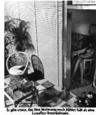
Es gibt etwas, das Ihre Meinung noch härter hält als eine Luftkette. (Sensationsmagazin)

Ja, die kommen aus einer besseren Zeit – hinsichtlich Freiheit, Geld, Gesundheit und sogar Geist – , und daher haben sie in dieser Ausstellung nichts verloren; sie will uns diese Dinge ja grade madig machen, ohne es zuzugeben.